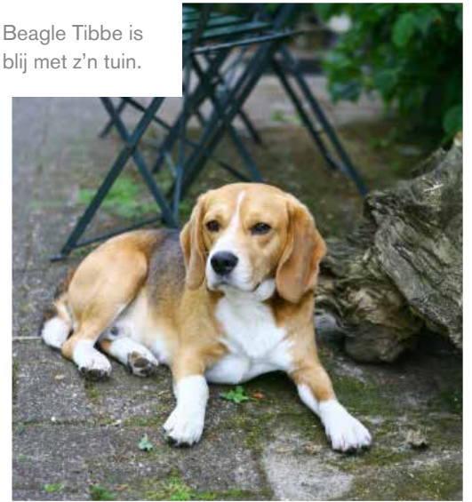
Beagle Tibbe is blij met z'n tuin.

Nu groeien onder en rond de boom onder meer de asters: Aster lateriflorus 'Lady in Black', A. 'Vasterival' , A. lateriflorus 'Prince', A. 'Prof. Anton Kippenberg' . Ze worden gecombineerd met siergrassen, waaronder lampenpoetsersgras ( Pennisetum setaceum 'Rubrum') en prachtriet ( Miscanthus sinensis 'Malepartus') en vaste planten als wederik ( Lysimachia clethroides ) en virginische ereprijs ( Veronicastrum virginicum 'Fascination'). Ook struiken, zoals japanse zuurbes ( Berberis thunbergii 'Atropurpurea'), kardinaalsmuts ( Euonymus ), meidoorn ( Crataegus monogyna ) en struikkamperfoelie ( Lonicera nitida 'Elegant') kregen een plek.